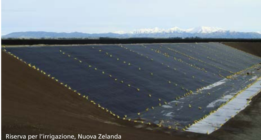
Riserva per l'irrigazione, Nuova Zelanda