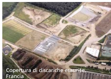
Copertura di discariche esaurite, Francia