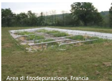
Area di fitodepurazione, Francia