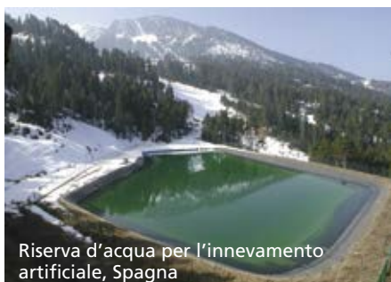
Riserva d'acqua per l'innevamento artificiale, Spagna