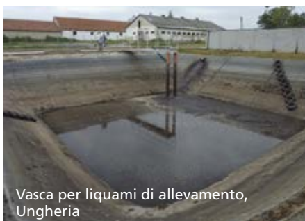
Vasca per liquami di allevamento, Ungheria