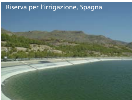
Riserva per l'irrigazione, Spagna