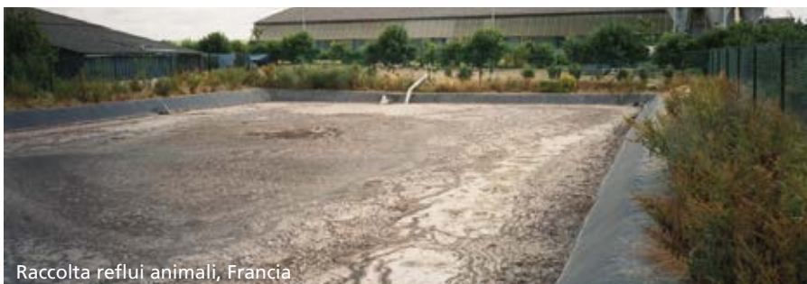
Raccolta reflui animali, Francia