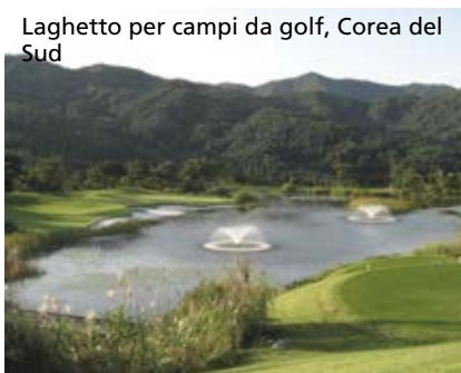
Laghetto per campi da golf, Corea del Sud