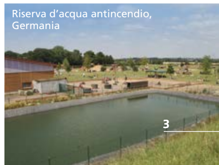
Riserva d'acqua antincendio, Germania