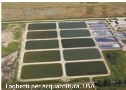
Laghetti per acquacoltura, USA