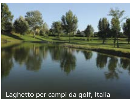
Laghetto per campi da golf, Italia