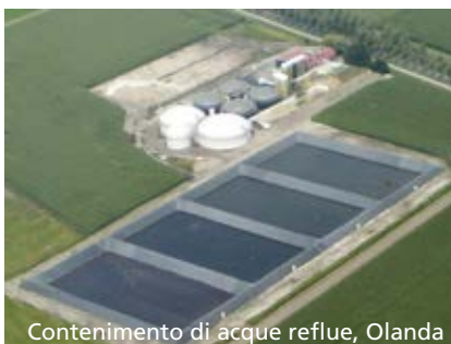
Contenimento di acque reflue, Olanda