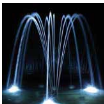
Ugello ad anello