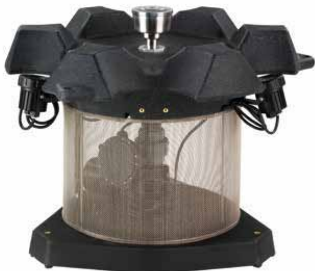
AT15F incluso ugello ad anello